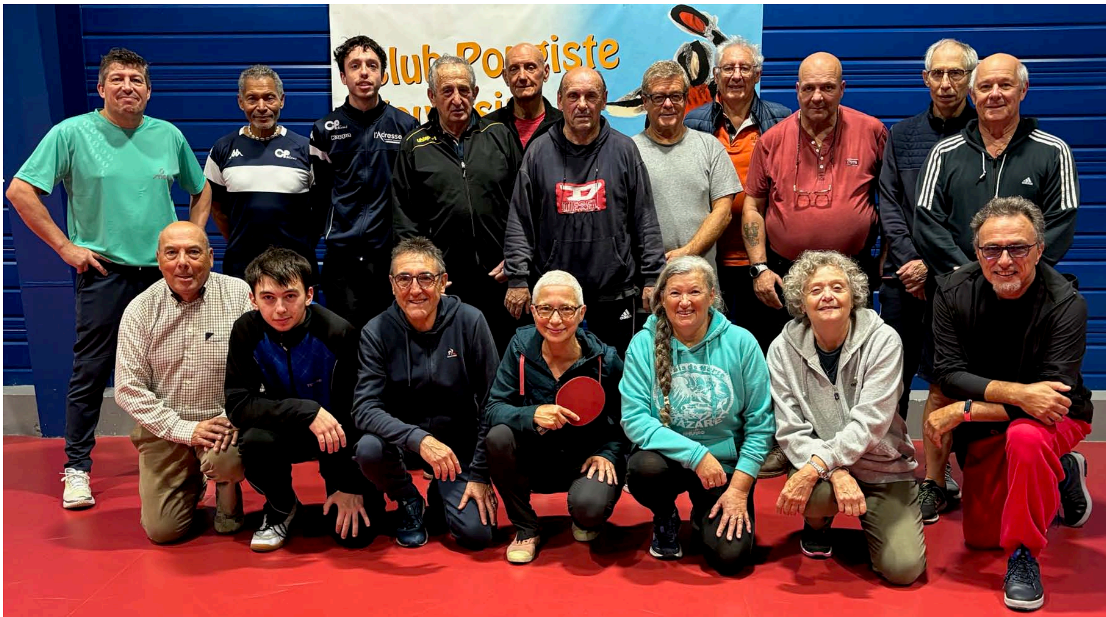
Stage vétérans du 28 au 31 octobre Réussite pour ce premier stage dans cette catégorie d'âge.