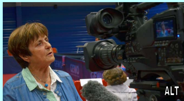
Photo : la présidente sous l'œil de la caméra.

Avec les articles passés dans Sud Ouest et les récents reportages de la radio France Bleu La Rochelle, le club se réjouit de cette couverture médiatique très satisfaisante.