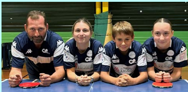
Fouras 6, Régionale 3, 5V, 1N, 1D, 2 ème , se maintient.

Photo : Amandine Egretaud, Matis Le Barrier, Illan Le Barrier, Colin Guinard.