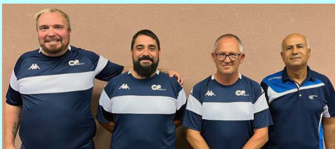
Fouras 4, en Régionale 3, 3V, 1N, 3D, 4 ème , se maintient.

Photo : Alain Masson, Mathieu Caperaa, Noé Malécot, Alexis Andron.