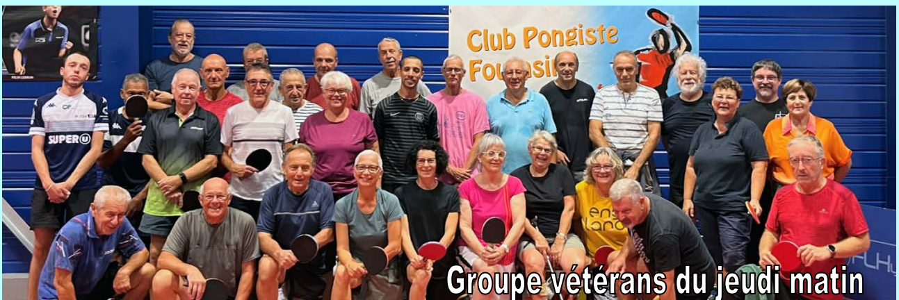
Groupe vétérans du jeudi matin