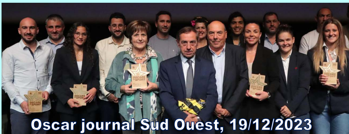
Oscar journal Sud Ouest, 19/12/2023