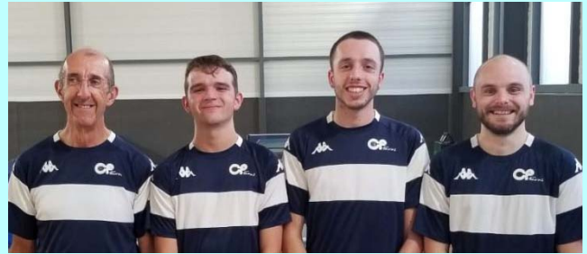
Fouras 3, en Régionale 2, 2V, 5D, 6 ème , se maintient

Photo : Rémi Chambet-Weil, Emmanuel Claveau, Thibault Hillairet, Maxime Battistello.