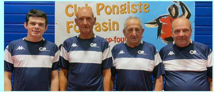
Fouras 11, en Départementale 3, 2V, 4D, 6 ème , se maintient