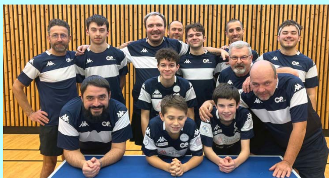
Photo : la délégation fourasine à Saint-Palais-sur-Mer.