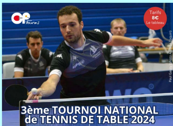
3ème TOURNOI NATIONAL de TENNIS DE TABLE 2024