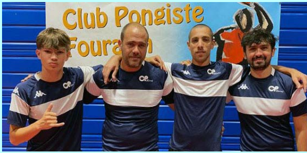
Fouras 10, en Départementale 2, 3V, 4D, 6 ème , se maintient

Photo : Martin Le Riche, François Lebugle, Julien Colinet, Kévin Hennekiné.