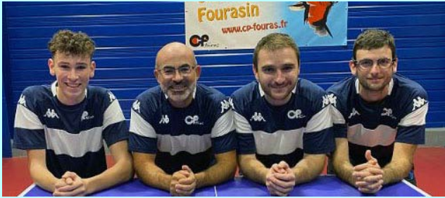
Fouras 2, en Nationale 2, 1N, 6D 8 ème descend en N3 !

Photo : Rémi Chambet-Weil, Emmanuel Claveau, Thibault Hillairet, Maxime Battistello.