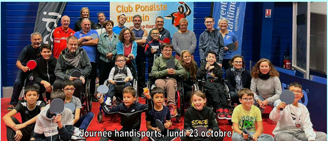
Journée handisports, lundi 23 octobre