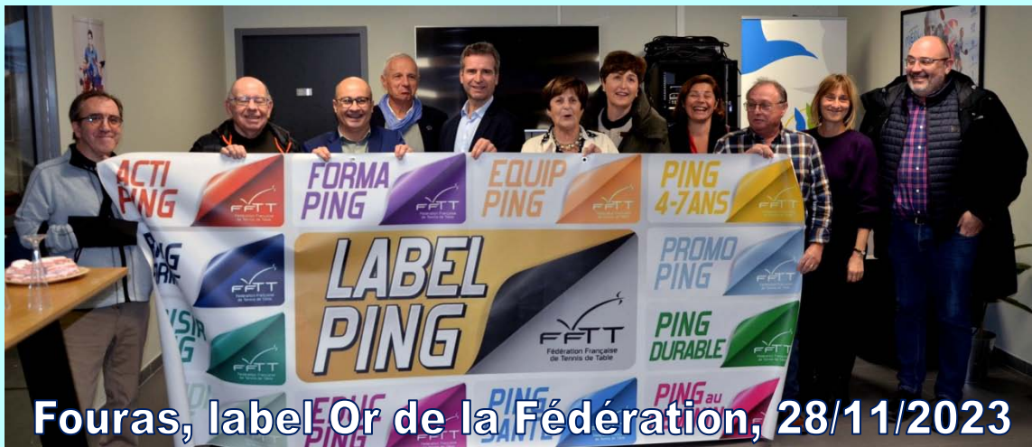
Fouras, label Or de la Fédération, 28/11/2023