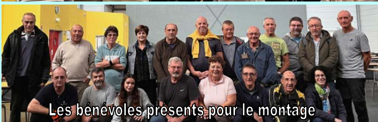
Les bénévoles présents pour le montage