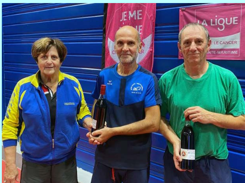
Les vainqueurs avec la présidente