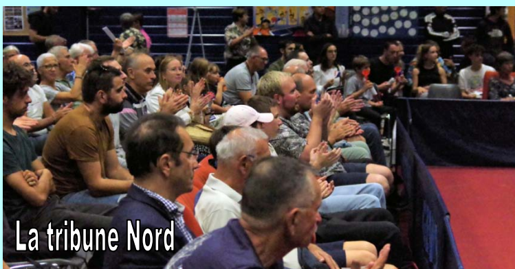
La tribune Nord