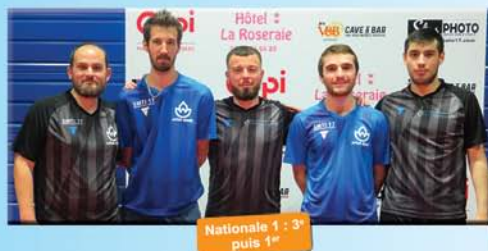
Nationale 1 : 3° puis 1°