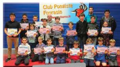
Ecole de tennis de table