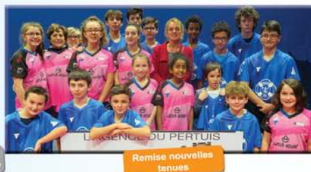
Remise nouvelles tenues